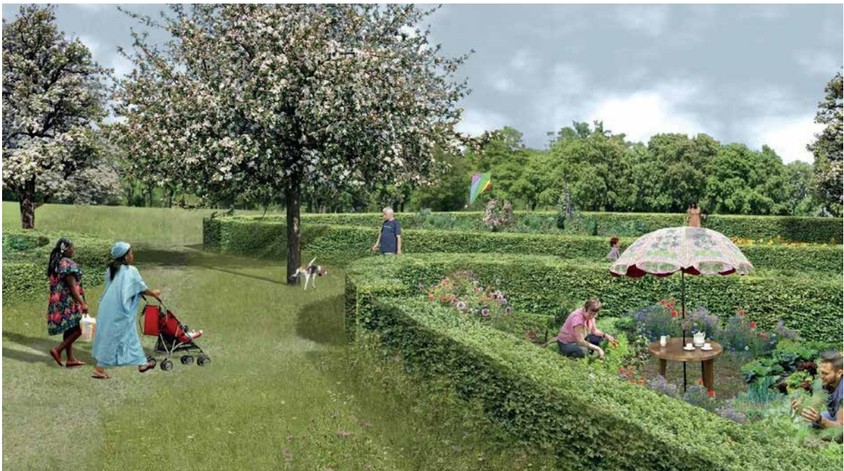
Viererfeldin / Mittelfeldin puutarha-alue - visualisointi: Raderschall Landschaftsarchitekten AG, Meilen (voittajatiimi VIF! Viererfeld Mittelfeldin kaupunkisuunnittelun ideakilpailun voittaja)

Seuraavat perhepuutarhaliikkeenme suuntautumista koskevat huomiot perustuvat välittömiin kokemuksiin ja vaikutelmiin sveitsiläisessä ympäristössä. Se, missä määrin ne ovat siirrettävissä kokonaan tai osittain muihin Euroopan maihin, on arvioitava siellä.